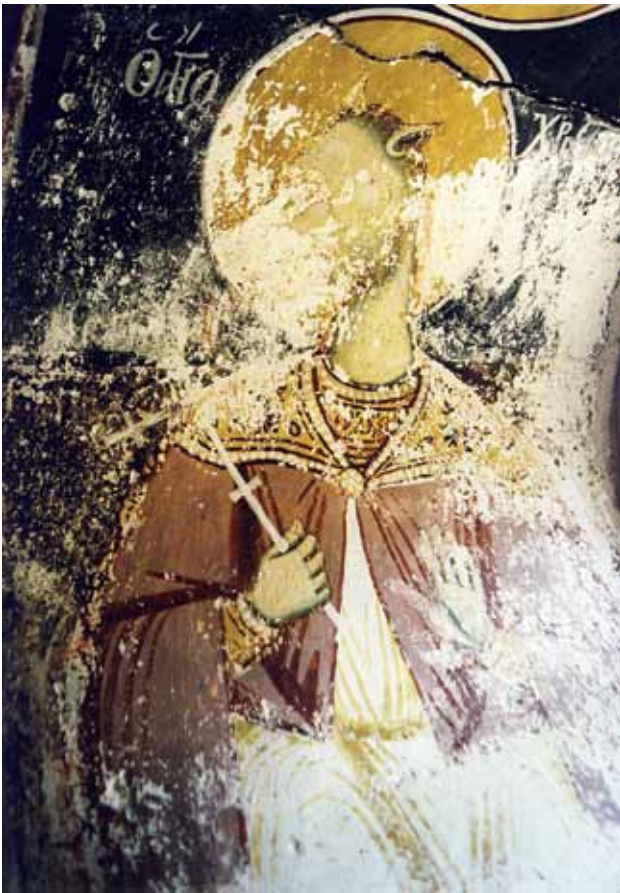
2. Свети Христофор, фреска непознатог грчког мајстора из хиландарског параклиса Богородичин покров, 1740.

2. St. Christopher Anonymus Greek painter, fresco, 1740, Chapel of the Veil of the Holy Virgin at Chilandar Monastery