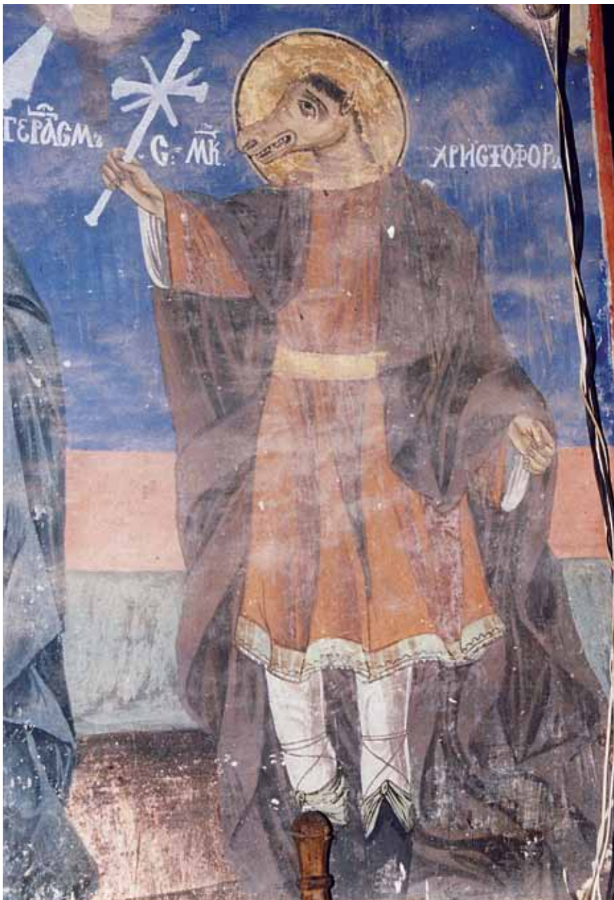
6. Свети Христофор, фреска из цркве Успења Богородице манастира Суково код Пирота, 1857/1858.

6. St. Christopher, fresco, 1857/1858, church of the Ascension of the Holy Virgin at the Sukovo Monastery near Pirot