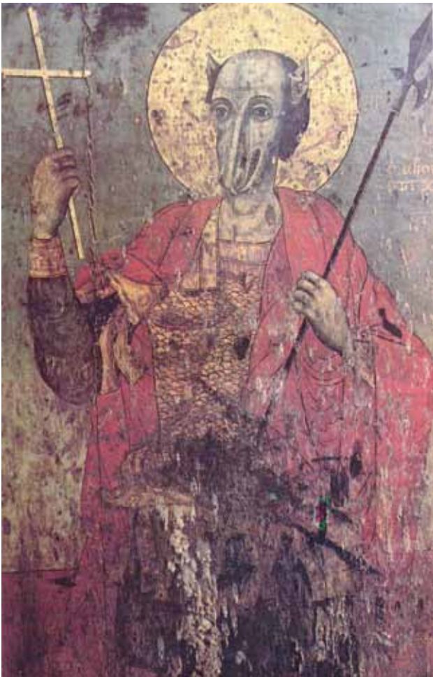
4. Свети Христофор, икона непознатог (грчког ?) мајстора, икона из цркве у селу Инџе Војвода код Бургаса, XIX век

4. St. Christopher Anonymus Greek painter, icon, 19 th Century, church at Indzhe Voivoda near Burgas