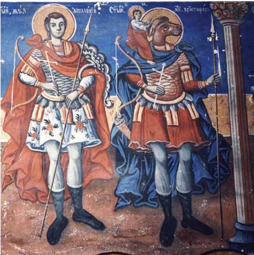
8. А. Дичов, Свети Христофор, фреска из манастирске цркве свете Богородице Пречисте Кичевске, 1880/1881. 8. A. Dičov, St. Christopher, fresco, 1880/1881, church of the Holy Virgin Immaculate at Kičevo

чекиване представе једног хришћанског мученика за ову православну монашку државицу. Псоглави лик светог Христофора у профилу из параклиса Богородичиног покроба, премда накнадно истрвене губице и очију, још увек има видљиве мале шиљасте уши налик роговима, првобитно вероватно вешто сликаног животињског лика. Светитељ у десној руци држи тањушни бели крст, а левом поздравља заштитничким гестом allocutio -е. Око-вратници и манжете доње одежде и пурпурне пелерине која се спреда копча на дугме, украшени су раскошном златотканом тканином опточеном низом ситних бисера. У прву половину XVIII века датована је и грчка икона из Музеја у Реклингхаузену где се свети Христофор подигнуте крупне главе налик свињској, у ратничкој спреми и пребаченом црвеном пелерином, налази у друштву са