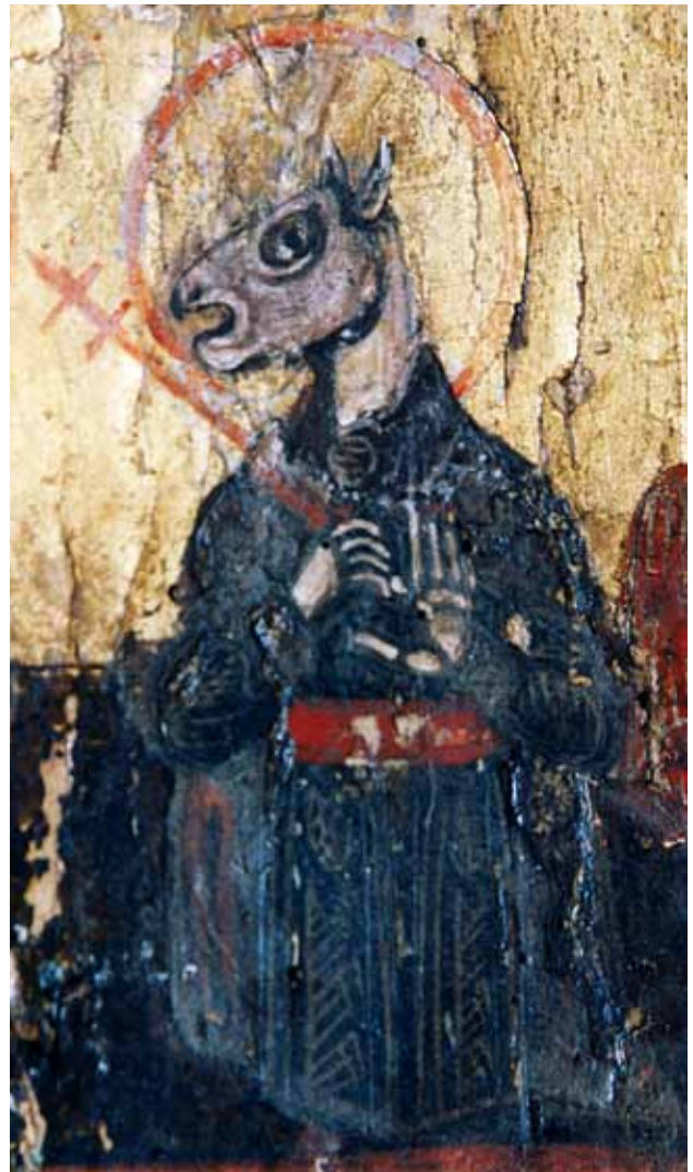
3. В. Рафаиловић, Свети Христофор, детаљ са престононе иконе из цркве светог Николе манастира Градиште, 1796.

штитом и крстом у рукама (Дечани; Протатон и Дохијар на Светој Гори), свети Христофор се на руским, румунским, српским, бугарским, грчким и синајским иконама и фрескама позновизантијског периода приказује и као поглави светитељ (грч. κυνοκεφαλος ) с ореолом, заоденут плаштом налик пелерини. Према цариградском Менологу Василија II (X век), свети великомученик Репрев(е), у хришћанству Христофор, живео је и пострадао у време римског цара Деција (249–251). Као наследник египатког бога Анубиса 24 , грчког Хермеса и римског Меркура, свети Христофор је, по легенди, потицао из варварског племена људождера и дивова са псећом главом 25 .