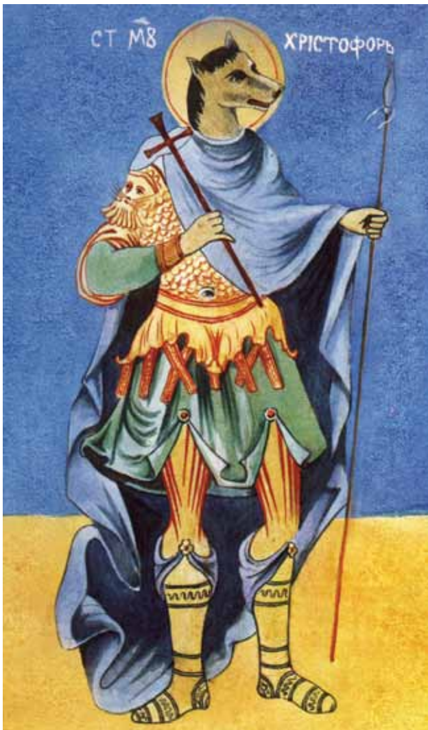
7. Свети Христофор, Акварел (1906) рађен по фресци из цркве светог Јована у Г. Матејевцу код Ниша, 1863. 7. St. Cristopher, watercolour (1906) after the fresco (1863) from the church of St John at Gornji Matejevac near Niš

вљан како држи крст, штит или копље-хелебарду или како једном руком благосиља. Овај ратник у име Христово, попут арханђела Михаила, понекад стаје ногом на савладаног демона, приказује се и како га Христос благосиља или крунише мученичким венцем или у тренутку док му се, подигнуте главе и отворених уста из којих вири језик, управо враћа изгубљена моћ говора. Поред руских (Ермитаж, Третјаковска галерија, Исто-