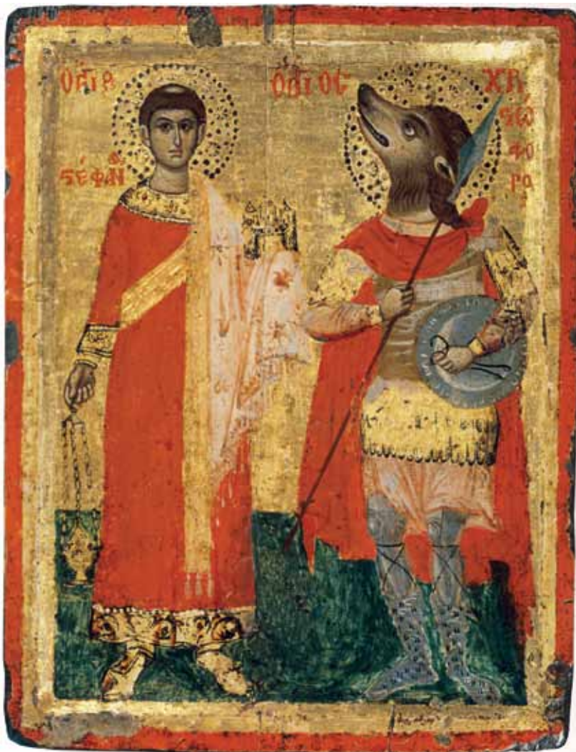
1. Свети Стефан и свети Христофор, Непознати грчки мајстор, прва половина XVIII века, Музеј икона, Реклингхаузен 1. SS Stephen and Christopher, Anonymus Greek Painter, first half of the 18th century, Ikonen-Museum, Recklinghausen

отац и одводи у хајку на лавове где Репробус увиђа да га се звери уопште не боје. Смртно рањени отац се опрашта од сина речима: „Таква је снага дар злих богова. Биће увек сâм и несрећан. Иди у свет и тражи онога ко је јачи и тежи од тебе!” Пошавши у свет, Репробус ступа у службу једног хришћанског краља, а потом се нуди још јачему, ономе који се никада не боји, ђаволу. Кренувши заједно на пут, они долазе до дрвеног Распећа од којег се ђаво уплаши толико да Репробус увиђа како убудуће треба да служи Христу. У потрази за њим, Репробус служи као скелеција, преносећи на раменима људе, ствари и стоку с једне на другу речну обалу. Једнога дана, на позив неког дечаћића, див, упркос невремену, упрти непознатог малог путника на леђа. Издржавши невероватно тешко бреме, Репробус изнемогао стиже на обалу где угледа како се дете које му се захваљује као Христофору истовремено претвара у горостасног човека. Огрнут белим плаштом и окруњен трновим венцем, он нестаје ка Сунцу, а Христофор коначно спознаје Христа. — уп. V. Nazor, Legenda o sv. Hristoforu , у: Sabrana djela Vladimira Nazora , XII, Zagreb 1977, 125–150, 270–305.